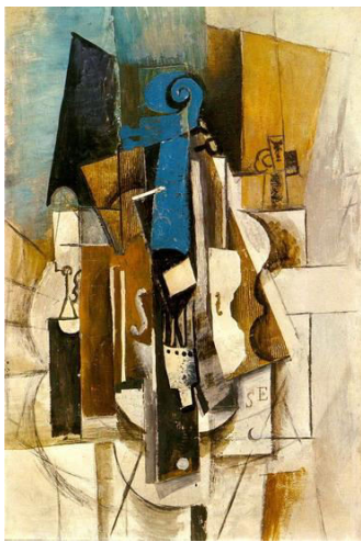
П. Пикассо. Скрипка в кафе.

Представитель кубизма П. Пикассо стремился утвердить новые методы передачи пространства и формы, используя аналитический способ изображения предметов разложением их на простейшие геометрические объемы.