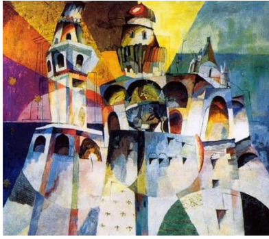
А. Лентулова. Звон (Колокольня Ивана Великого)

Представитель кубизма П. Пикассо стремился утвердить новые методы передачи пространства и формы, используя аналитический способ изображения предметов разложением их на простейшие геометрические объемы.