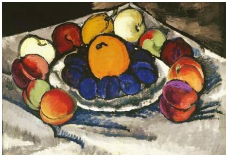
И. Машков. Натюрморт. Фрукты на блюде.

Фовисты создавали колористические контрасты интенсивных пятен и острые композиционные ритмы, часто обращаясь к примитивному, а также средневековому и восточному искусству. Декоративные натюрморты И. Машкова были созданы под влиянием кубистов и фовистов. Машкова называют «королем натюрмортов», и это звание вполне заслужено. «Фрукты на блюде» написаны в период освоения художником плоскостной живописи, жанра вывески.