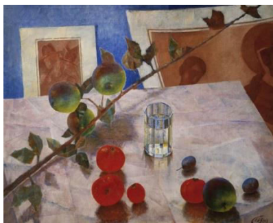
К. Петров-Водкин. Розовый натюрморт.

Натюрморт наиболее показателен и многообразен в плане изучения признаков декоративной стилизации. В нем работали многие большие мастера такие как К. Петров–Водкин, А. Матисс, шли по пути выявления декоративно – экспрессионистических возможностей цвета и фактуры.